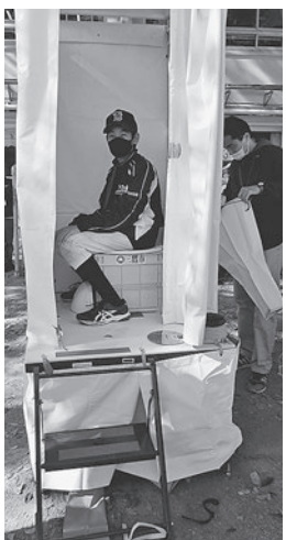
トイレに入ってみました

防災訓練として簡易仮設トイレの和式と男性用小便器を各1基組み立てました。小便器は二つ折りを開くだけで、とても簡単です。和式トイレは重く部品