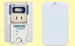
感震コンセント KC-102 感震ブレーカー coco断 ※工事不要です